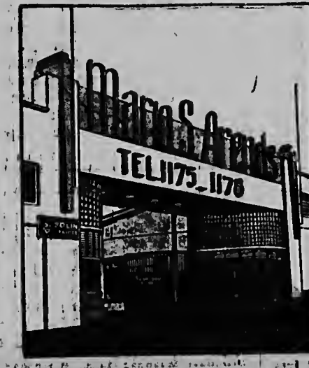
TUR SORTO DI VERI

Desde el 2 de octubre se eleva el número de servicios de carga. Entre Amsterdam y Nueva York se ejecutarán tres vuelos semanales, con Liffmasters y Skymasters, uno de los cuales pasará por Montreal. Se inaugurarán un servicio de carga quincenal Amsterdam-Curazao. Un Liffmaster tomará tierra una vez por semana en Teheran y Eky-masters irán tres veces al mes al Lejano Oriente. Los servicios de carga no sufren modificación alguna en Europa, en consecuencia, Londres seguirá gozando de 10 vuelos por semana y Copenhague, Basilea, Frankfurt, Stuttgart y Nurenberg de los mismos que el pasado verano.